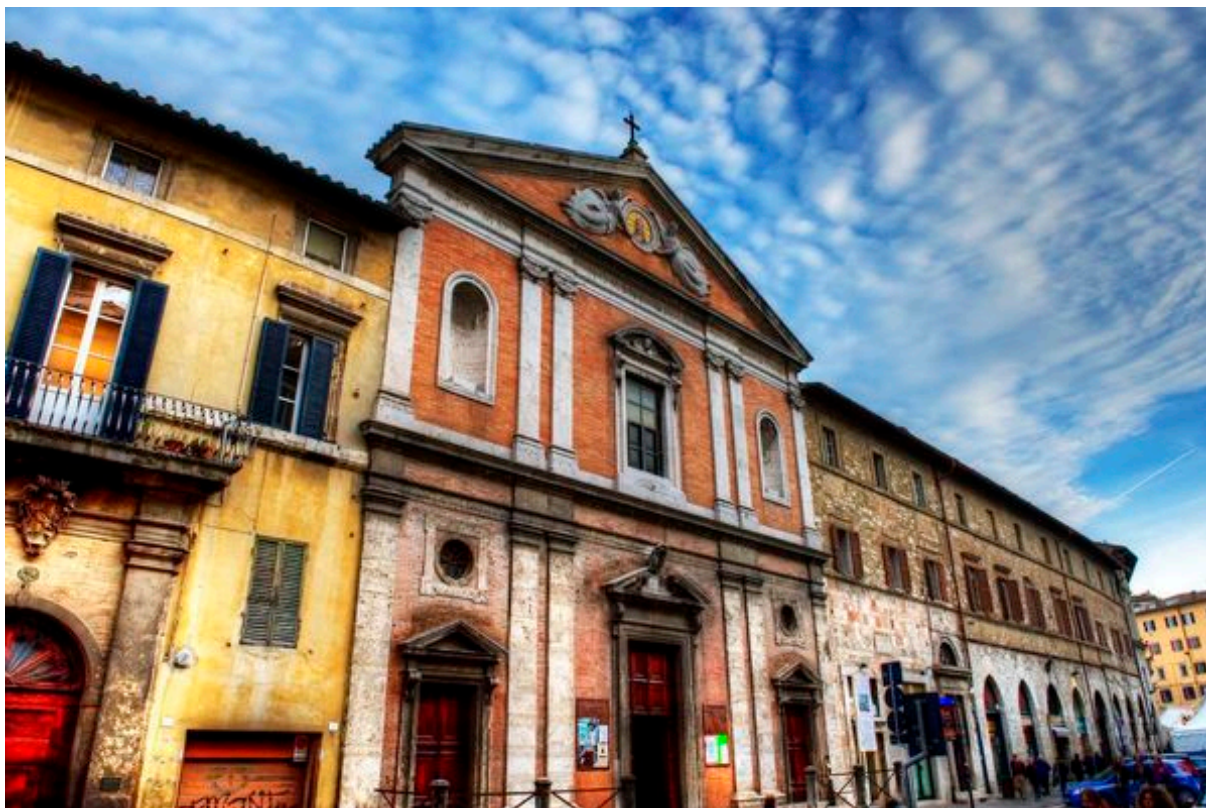
Perugia, Piazza Matteotti – Il Palazzo del Capitano del Popolo e Chiesa del Gesù